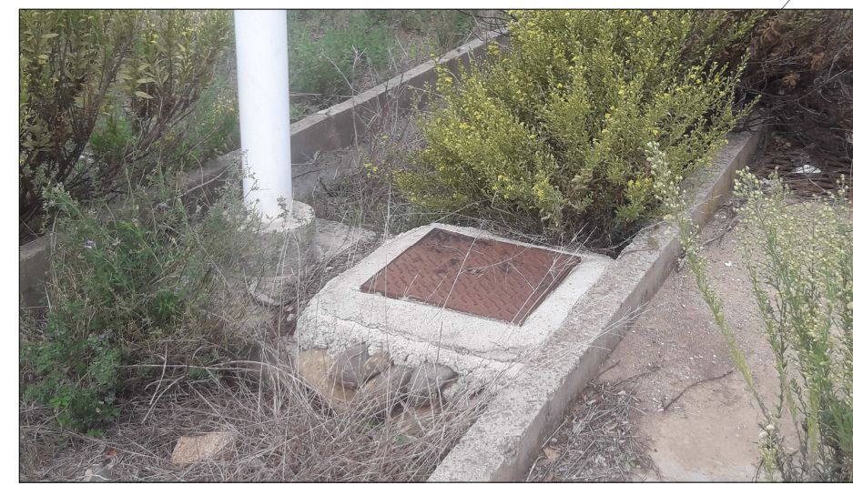
Foto 8 - Particolare pozzetto di derivazione e palo con armatura stradale