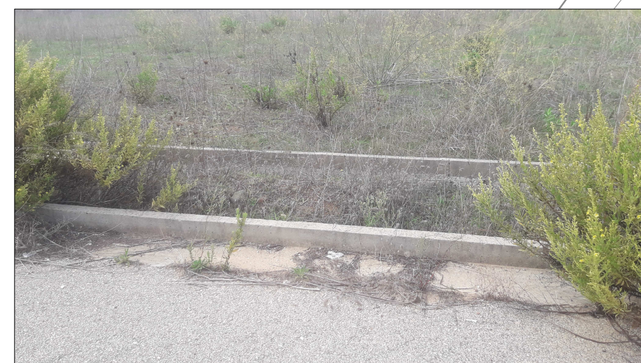
Foto 6 - Particolare cordonata stradale/marciapiede