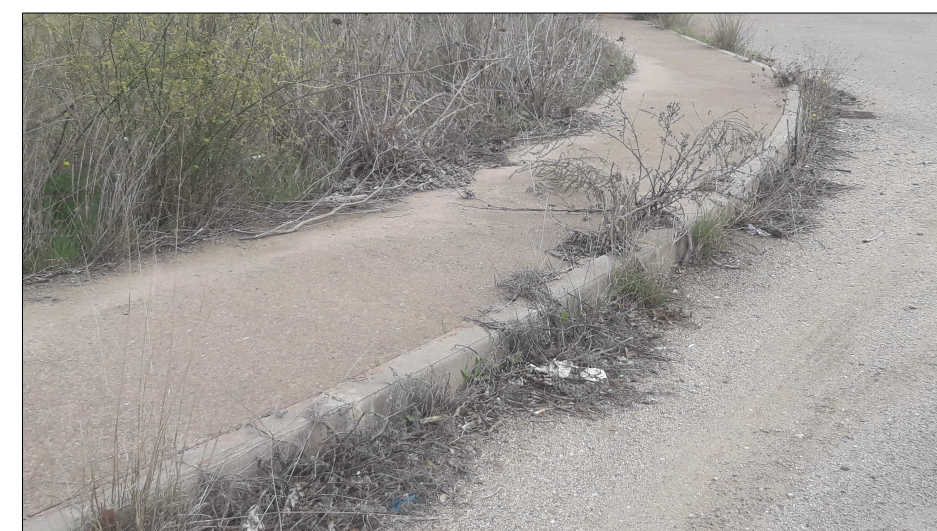
Foto 3 - Particolare cordonata stradale/marciapiede strada intercomunale