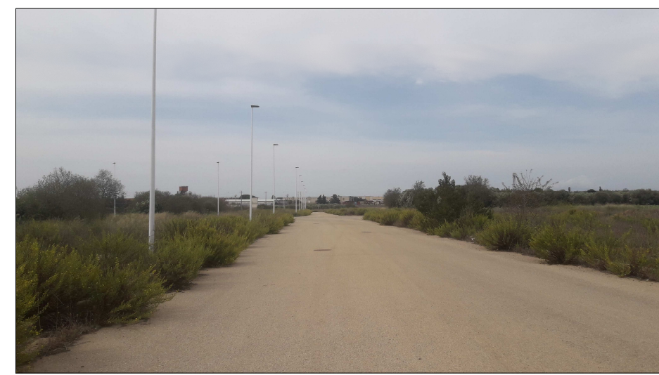
Foto 1 - Particolare strada di piano - Vista nord-ovest