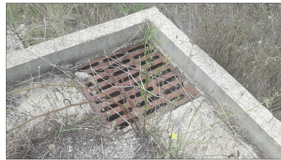
Foto 7 - Particolare caditoia per acque meteoriche