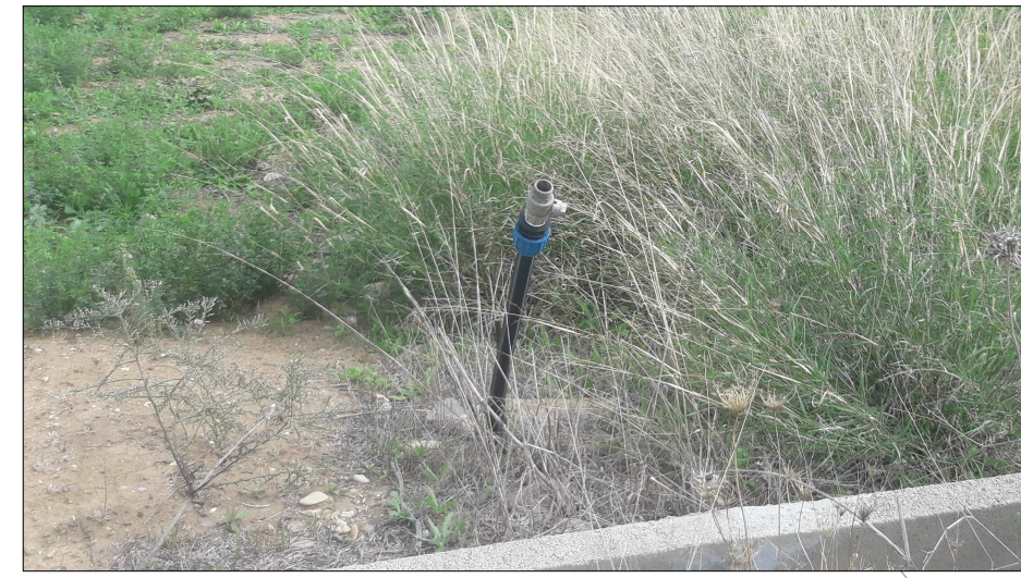
Foto 10 - Particolare rete idrica di adduzione ai lotti