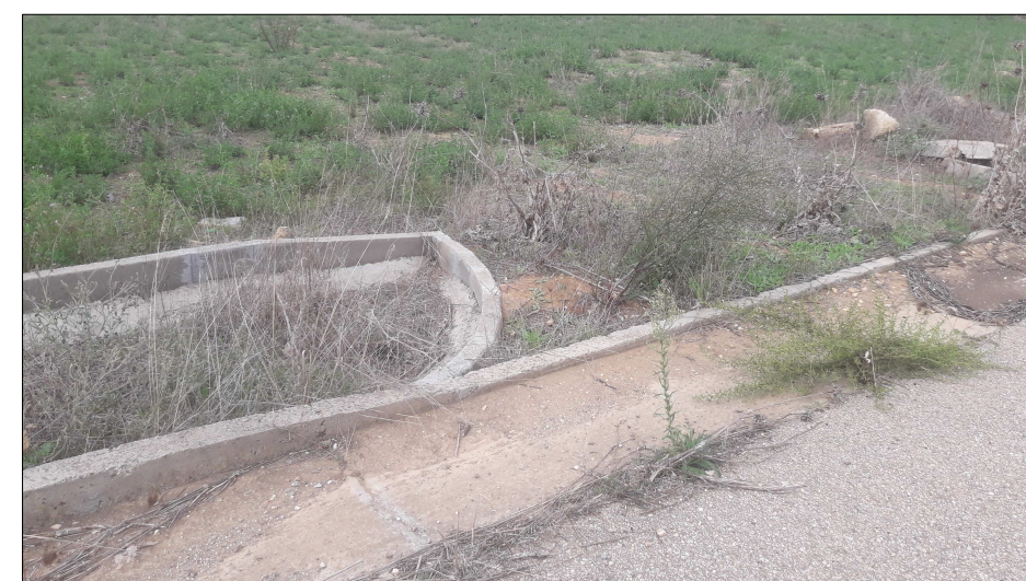
Foto 5 - Particolare cordonata stradale/marciapiede in prossimità degli accessi