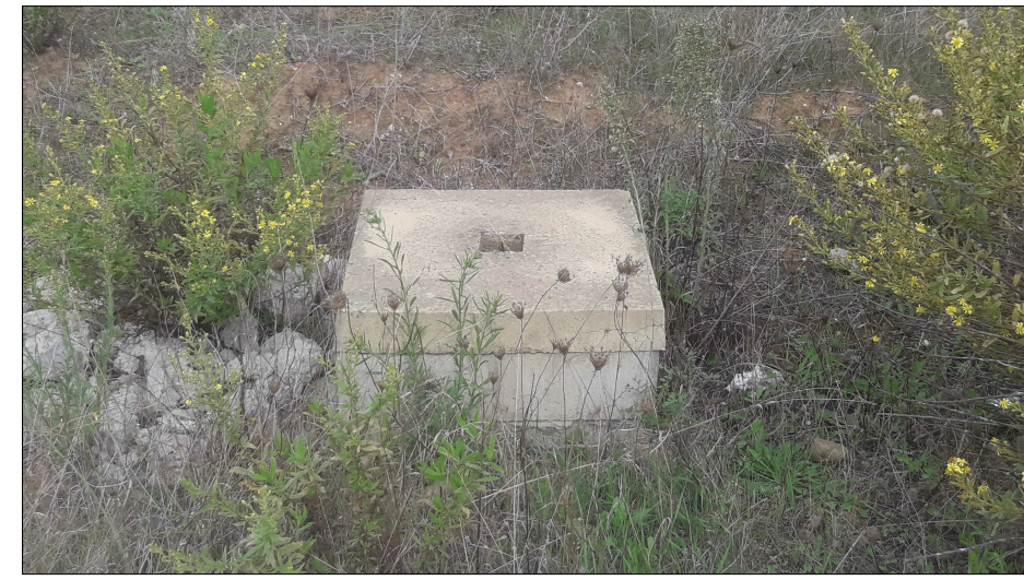
Foto 9 - Particolare pozzetto sifonato rete fognaria