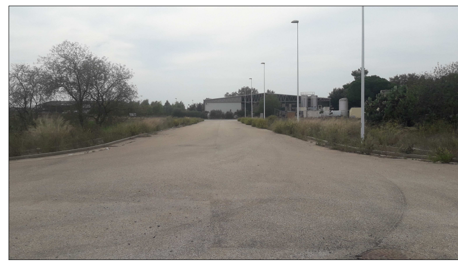
Foto 2 - Particolare strada di piano - Vista sud-ovest