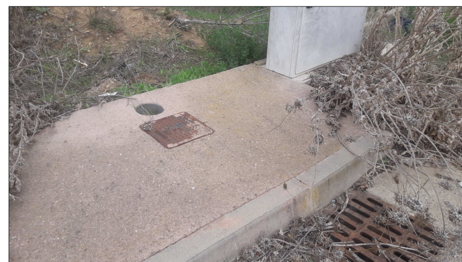
Foto 4 - Particolare pozzetto di derivazione con predisposizione palo